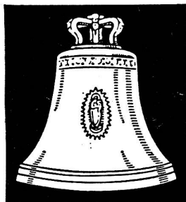
Aarauer Glocken seit 1367

Anmeldung sofort an das deutsche Sekretariat der «Bewegung für eine bessere Welt», Gluckstraße 4, 53 Bonn