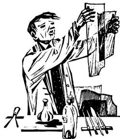
SEIT 3 GENERATIONEN

KIRCHENGOLDSCHMIED ST. GALLEN - BEIM DOM TELEFON 071 - 22 22 29