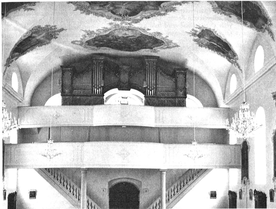
Neue Kirche in Silenen

O. Emmenegger, Merlischachen Restaurierer