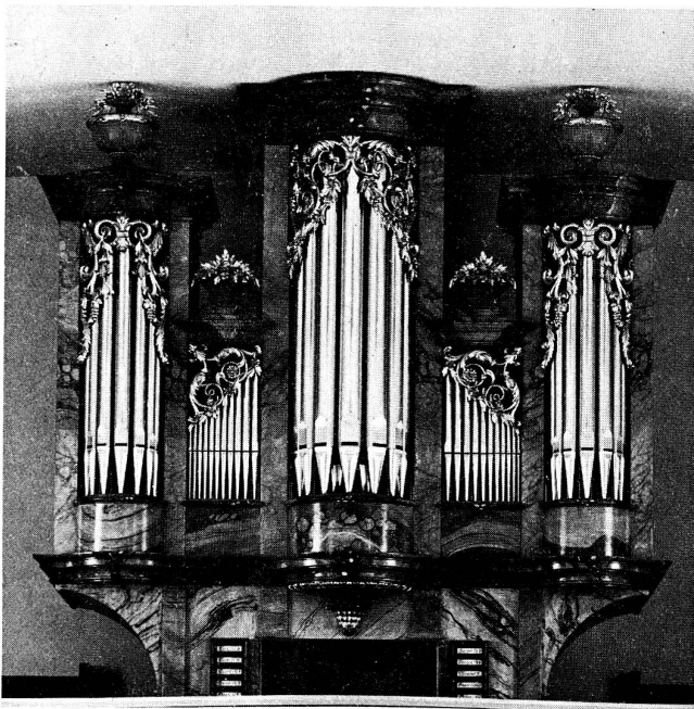
Katholische Pfarrkirche Bettwil (AG)