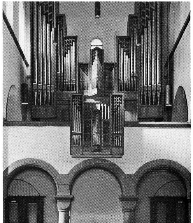
Neue Orgel Katholische Kirche Küssnacht (ZH)