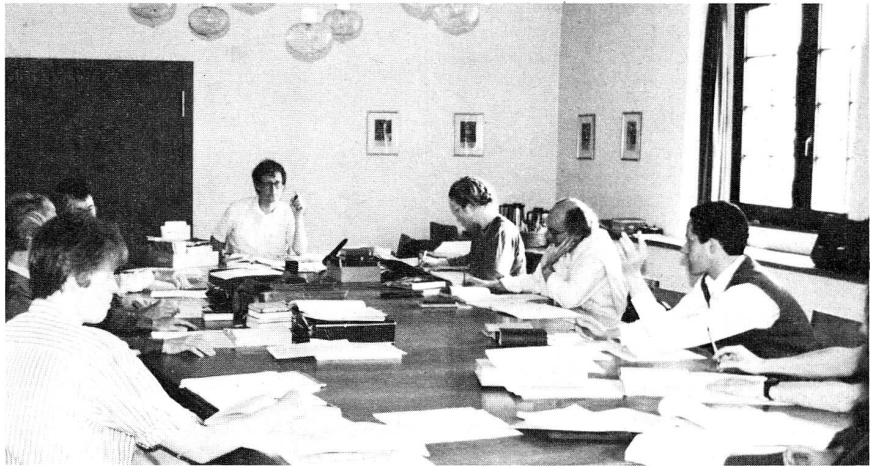
Bei den Vorarbeiten zum heutigen Kirchengesangbuch wäre es noch undenkbar gewesen, dass ein katholischer Kirchenmusiker an den Sitzungen hätte teilnehmen können. Vermutlich hätte er sich, wie auf unserem Bild, versteckt...

Stefan: Wir bewegen uns eindeutig auf eine breitere gemeinsame Basis hin, haben jetzt schon gut hundert gemeinsame Lieder ausge-