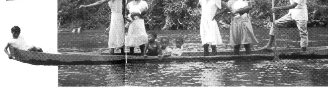
Die kolumbianische Pazifikküste ist 1 300 km lang und umfasst ein Gebiet von 73 000 km 2 , in welchem etwa eine Million Menschen leben. Vier Fünftel von ihnen sind afrikanischer Herkunft. Das Departement Choco, mit seinem einzigartigen, intakten Regenwald am mittleren Atlantik ist 43 000 km 2 gross.

Denn ein Mann hat mehrere Frauen, zwei oder drei. Darum ist es die Frau im Haus, die für Ordnung sorgt und die Beziehungen regelt. Deswegen haben wir auch viel beizutragen zum Aufbau einer neuen Gesellschaft.