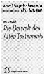
Die Umwelt des Alten Testaments, Verlag Katholisches Bibelwerk, Stuttgart, Fr. 46.-

Sozialgeschichtliche, politische, intellektuelle und religiöse Kontexte haben das Erste Testament in zunehmend sichtbarem Mass geprägt. Die einschlägige Forschung droht sich aber in Fachpublikationen einzuzugeln, die eher den Namen «Verheimlichungen» als «Veröffentlichungen» verdienen.