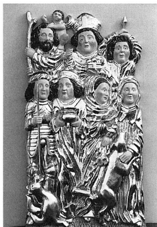
Marienkirche Bertiswil (LU)