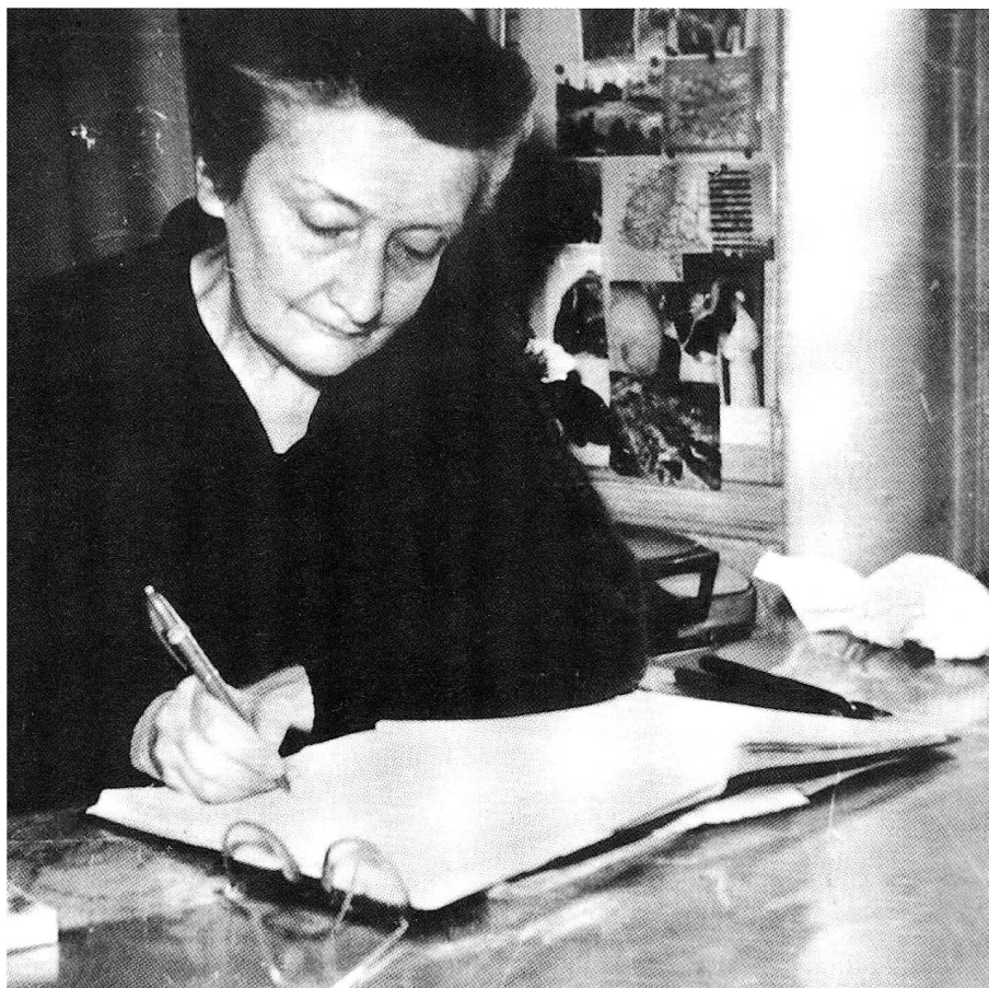
Madeleine Delbrêl.

Lehramt nicht vornehmlich an Seelsorger, innerkirchliche Gruppen, Verbände, Aktionsgemeinschaften usw., sondern unmittelbar an den «Bürger dieser Welt» als Appell an seine christliche Eigenverantwortung sowie an alle Menschen guten Willens (dies wird durchaus auch aus dem Schreiben Octogesima adveniens Pauls VI. ersichtlich, auf das vor allem sich die Autorin, allerdings etwas einseitig, abstützt). Das soziale Lehramt der Kirche versteht sich heute mehr in die Wirklichkeit der modernen Welt eingelassen, als dies für die um eine Wiederbelebung des «katholischen Milieus» kreisende Bemühung von Marianne Heimbach-Steins zuzutreffen scheint. Paradoxerweise scheint sie für ein Mehr an verbindlichem kirchlichen Lehren einzustehen (unter Beiziehung professioneller Theologie und der kirchlichen «Basis», womit allerdings in der Praxis jeweils nur die Basis der kirchlich beamteten bzw. organisierten Christen gemeint sein kann), was aber unweigerlich auch ein Mehr an Bevormundung jener grossen Schar von «Normalchristen» bedeuten würde, die mit beiden Füßen in dieser Welt stehen und diese, in ihren Aufgaben in Beruf, Familie, Gesellschaft und Politik, in Zusammenarbeit mit ihren Mitbürgern auch effektiv gestalten.