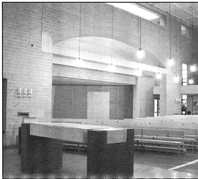
Kath. Kirche Bern Köniz