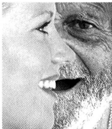
Zur Verständigung gehört das Hören

Rund 200 Personen nahmen in Neuenburgs auffälligstem Gotteshaus, der im letzten Jahrhundert aus rotem Ziegelstein erbauten katholischen Kirche "Notre-Dame de l'Assomption", am Eröffnungsgottesdienst teil.