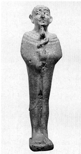
«Werbung für die Götter. Heilsbringer aus 4000 Jahren» Sonderausstellung im Museum für Kommunikation, Bern, bis 25. Januar 2004, Dienstag bis Sonntag 10 bis 17 Uhr (Bild: Amulett in Gestalt eines stehenden Ptah; siehe Seite 199).

Die «Reformierten Medien» – vormals Evangelischer Mediendienst – können sich als «das Kommunikationsunternehmen der evangelisch-reformierten Kirchen der deutschsprachigen Schweiz» vorstellen, während der Katholische Mediendienst die kirchliche Medienarbeit in den Bereichen Film und Audiovision, Radio und Fernsehen, Medien- und Online-Kommunikation der deutschsprachigen Schweiz im Auftrag der Bischofskonferenz wahrnimmt. Als Ökumenische Mediengruppe bieten diese beiden Mediendienste gemeinsame Dienstleistungen an, namentlich über den Medienladen , das auf den 1. Juli 2000 eingerichtete ökumenische Multimediazentrum für Audiovision und Beratung in Zürich.