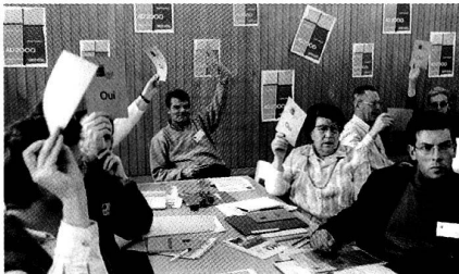
Delegierte der Diözesanversammlung stimmen ab.

Was die Verwaltung des Pfarreivermögens betrifft, so habe der Pfarreirat entschieden, in Ethikfonds zu investieren und jedes Jahr 7,5 Prozent der Pfarreimittel in Sozialwerke zu geben, so der Pfarrer weiter. Zudem sei beschlossen worden, mit einem Projekt eine Pfarrei in Guatemala zu unterstützen, die Schwierigkeiten habe, ihre beschädigte Kirche zu restaurieren. Für Marc Donzé