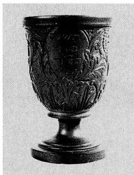
Sabbat – Sabbatruhe – Sabbatfreude Kidduschbecher, Jerusalem 1844, Jüdisches Museum der Schweiz in Basel (Öffnungszeiten: Sonntag 11–17 Uhr, Montag und Mittwoch 14–17 Uhr).

Ruhe, diese Einsicht werden viele bestätigen können, lässt sich nicht machen. Selbst wenn freie Zeit da ist, muss sie sich nicht automatisch einstellen. Ruhe ist ein Geschenk. Und Geschenke werden bekanntlich gegeben. Ruhe kann sich einstellen, wenn bestimmte Bedingungen erfüllt sind, oder, negativ formuliert: Sie lässt sich verhindern. Das dürfte einer der Gründe sein, weshalb Ruhe so unterschiedlich gewertet wird. Wiederum soll die Sonntagsruhe als Beispiel dienen: Wieso soll es nicht möglich sein, an einem Sonntag einzukaufen, in aller Ruhe? Es muss ja niemand, wenn er/sie nicht will. Solche Argumente sind nicht neu. Schon die Römer konnten es nicht verstehen, dass die Menschen jüdischen Glaubens stur einen Tag nicht arbeiteten. Sie feierten Schabbat. (So wie es auch heute Christen und Christinnen gibt, die nicht verstehen, dass Menschen jüdischen Glaubens Schabbat feiern und dabei ganz bestimmte Regeln strikte einhalten.) Aus Sicht bestimmter römischer Kreise war dies eine reine Zeitverschwendung. Doch aus jüdischer Sicht sah und sieht es anders aus: Schabbat ist die Zeit des Aufhörens, Feierns. In seiner wohl ältesten Form lautet das Gebot apodiktisch: