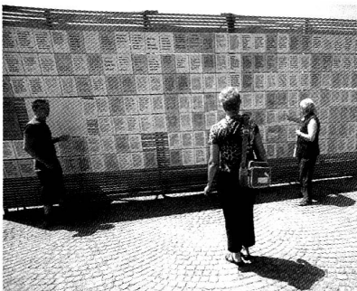
Die "Clinch-Mauer"

Hunderte von fein säuberlich angebrachten Blättern im A4-Format geben darüber Auskunft, was die Menschen der Kirche zu klagen haben – aber auch