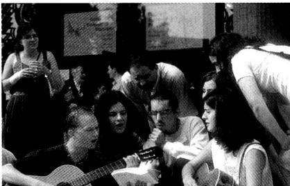
Gesang am Colloquium

Statt die Zukunft der Pfarreien fast ausschliesslich vom herrschenden Priestermangel her und damit nostalgisch zu