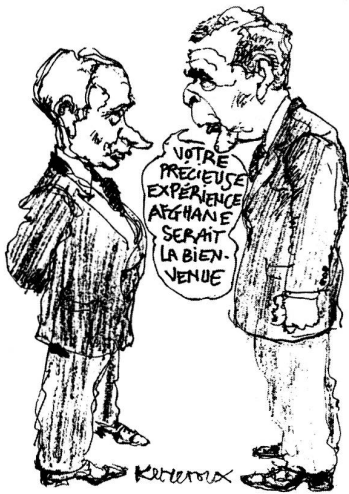
Irak-Sorgen. – "Ihre wertvolle afghanische Erfahrung wäre sehr willkommen", sagt Bush zu Putin in der Karikatur des "Canard enchaîné".