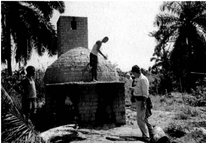
Brennofen der Pfarrei