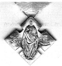
Die päpstliche Medaille

So kann im Bistum Basel, das jährlich gegen 30 Bene-Merenti-Medaillen vergibt, eine solche Auszeichnung erhalten,