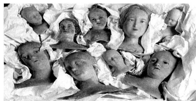
Wachsköpfe zur Anfertigung von Krippen und Katakombenheiligen

"Jenseits des Sichtbaren – Reliquiare und Klosterarbeiten" heisst die Ausstellung im freiburgischen Museum für Kunst und Geschichte. Gezeigt wird eine Fülle von "schönen Arbeiten", die von vielen Generationen von Freiburger Klosterfrauen in gewollter Anonymität hergestellt wurden – ausschliesslich zur höheren Ehre Gottes.