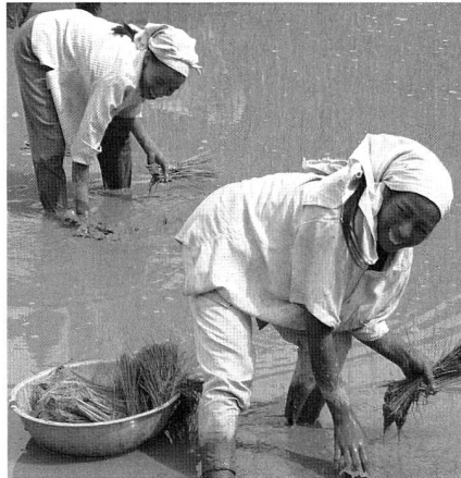
Reisbäuerinnen im philippinischen Mindanao

Ende der neunziger Jahre wollten Bauerngenossenschaften etwas gegen den neuen Hunger unternehmen. Sie