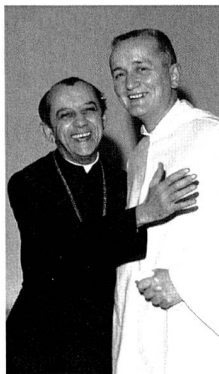
Symbol des "Neuansatzes der Offenheit" des Konzils: Helder Camara und Roger Schutz

Christian Rutishauser: Nostra Aetate ist eine schlichtweg revolutionäre Erklärung! Zum ersten Mal in 2.000 Jahren Kirchengeschichte hat sich die oberste Instanz der katholischen Kirche vor 40 Jahren positiv über die andern Weltreligionen geäussert und zum Dialog aufgefordert.