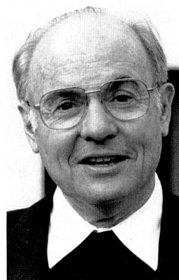
Bischof Ivo Fürer

Bischof Fürer bemühte sich ferner um gute Beziehungen zur Universität St. Gallen. "Auch wenn diese Kontakte nicht einen grossen Zeitaufwand bedeuteten, so sind sie für mich sehr bedeutsam." Das Managementsymposium in St. Gallen habe ihm erlaubt, mit Politikern, Ökonomen und Wissenschaftler