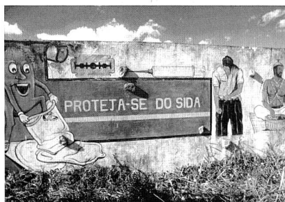
Anti-Aids-Plakat in Mozambique

Mr. Brian wirkt ausgebrannt. Denn er ist seit dem Aufkommen der Aidsmedikamente nicht nur Segensbringer, sondern auch Scharfrichter. Sein Richtbeil ist der so genannte CD4-Wert. Normalerweise steht er bei rund 1.200. Erst wenn dieser Wert unter 200 gefallen ist, hat der Patient ein Anrecht auf eine Be-