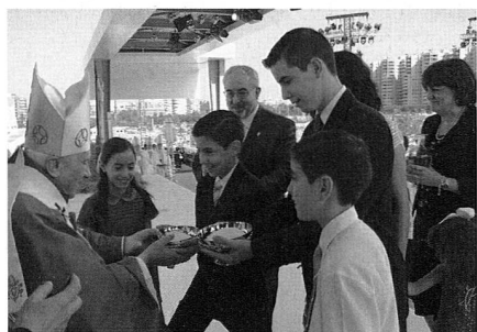
Begegnung einer Familie mit Papst Benedikt XVI.

Für den Papst war die Reise zum Abschluss des V. Weltfamiliantreffens ein Heimspiel. Bei seiner Rede am 8. Juli bekräftigte er die Unverzichtbarkeit der Familie für die Gesellschaft, ermunterte die Gläubigen zu einem Leben als Hauskirche und forderte angemessene Würdigung der Grosseltern. Am 9. Juli hob er die Gemeinschaft der Generationen hervor.