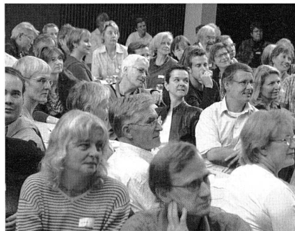
Zuhörerinnen und Zuhörer am 28. Oktober in Luzern

aktiv und einfühlsam engagieren". Eine Änderung der Zulassungsbedingungen zur Weihe falle nicht in die Kompetenz der Ortskirchen, sondern könne nur weltkirchlich entschieden werden. Hingegen seien in einigen Schweizer Bistü-