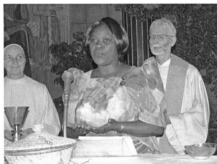
Gottesdienstfeier mit Laien

Deswegen richtet er deutliche Worte an die Priester, verlangt von ihnen mehr Feierkultur, bessere Predigten und weniger Entertainment. Der Zelebrant soll sich nicht in den Mittelpunkt stellen, sondern die Begegnung mit dem Geheimnis des Glaubens ermöglichen. Eine