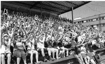
Auch die "Welle" flutete durch das Fest

Das Festgelände wurde nach den fünf Grundsätzen der Jungwacht und Blauring in fünf "Welten" und Farben eingeteilt: In der roten konnten die Besucher "zusammen sein", die grüne lud zum