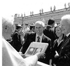
Übergabe des Buches «Treu, redlich und ehrenhaft» von Schweizergarde-Fotograf Stefan Meier an Benedikt XVI. (Siehe Nachlese zur Schweizergarde Seite 417.)

Wo es um Geld geht, nistet sich auch schnell Zwi-lichtiges ein. Das war bereits bei der WM 06 in Deutschland der Fall, wo sich das Problem der Zwangsprostitution verschärft gestellt hat. Acht Schweizerische Frauendachverbände, darunter auch der Schweizerische Katholische Frauenbund, lancieren deshalb 2007 im Hinblick auf die Euro 08 eine Kampagne zum Thema Zivilcourage am Beispiel des Menschenhandels und der Zwangsprostitution. Der Projektstart findet am heutigen 14. Juni statt. Das Projekt wird am 25. November 2007, dem Internationalen Tag gegen Gewalt an Frauen und Mädchen, beendet. Im «Matronatskomitee» (eben nicht «Patronatskomitee») finden sich Vertreterinnen aus den Eidgenössischen Räten aus dem ganzen Parteienspektrum.