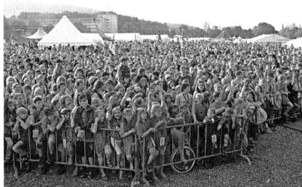
Warten auf den nächste Event

um, so liess man sich schnell von den Kindern anstecken: Ohnehin schon nass von der Seifenrutschbahn oder dem