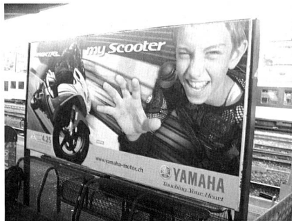
Mit Leasing wird gezielt eine junge Kundschaft angesprochen.

Die Kampagne arbeite nicht mit dem "Mahnfinger", sondern strebe bei den Jugendlichen eher eine bewusste Verhaltensänderung an, sagt er. Ein wichtiges Ziel sei es, jungen Erwachsenen mit eigenem Einkommen mittels Budgetplanung dabei zu helfen, ohne Schulden über die Runden zu kommen.