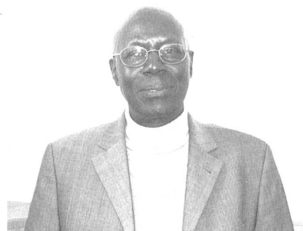
Bénézet Bujo formuliert afrikanische Anfragen an das westliche Christentum.

Viele afrikanische Völker gehen von der grundlegenden Idee aus, dass die Ehe nicht durch einen punktuellen Vertrag geschlossen wird. Vielmehr verpflichtet sie die ganze Gemeinschaft derer, die das Paar begleiten. Nicht nur zwischen Mann und Frau wird die Verbindung eingegangen, sondern zwischen den Familien im afrikanischen Sinne des Wortes, das heisst, zwischen den ganzen Clans. Die Missionare stürten sich daran, dass es bei diesen Etappen einen Zeitpunkt gibt, ab dem