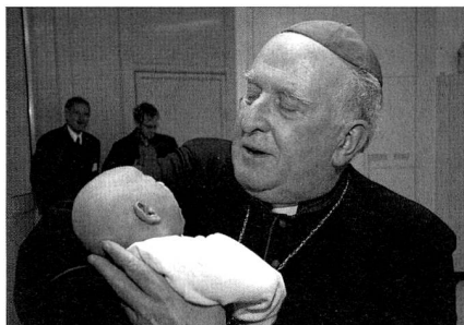
Pier Giacomo Grampa, Bischof von Lugano, mit einem Säugling im Caritas-Baby-Hospital in Bethlehem.

In Bethlehem unternahmen die Bischöfe auch einen Abstecher in das Caritas-Baby-Hospital. Im Jahr 1952 von dem Schweizer Priester Ernst Schnydrig gegründet, ist es das einzige Kinderkrankenhaus im Westjordanland. Es wird von den Schweizer Katholiken