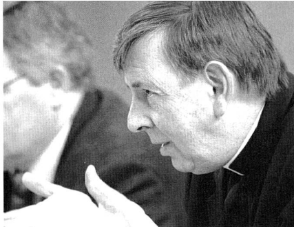
Der Basler Bischof und SBK-Vorsitzende Kurt Koch erläutert vor den Medien die Erklärung der Bischöfe.

Die deutschsprachige Redaktion der Presseagentur Kipa zieht im Januar 2009 von Freiburg nach Zürich, um näher beim deutschsprachigen Medienmarkt zu sein und dort in enger Zusammenarbeit mit dem vom Katholischen Medien dienst betriebenen Internetportal kath.ch höhere Wirksamkeit zu erzielen. Die französischsprachige Redaktion von Kipa (Apic) bleibt hingegen in Freiburg.