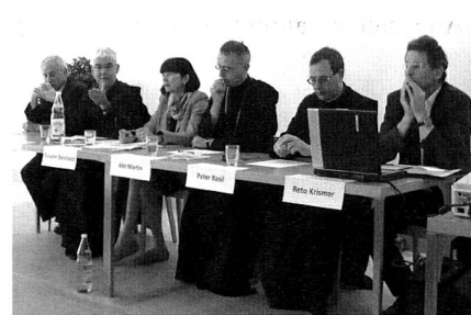
Die Klostervertreter vor den Medien