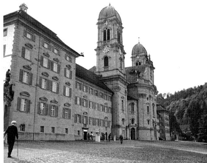
Millionen-Projekte: Kloster Einsiedeln

Daneben stehen zwei grosse Sanierungsprojekte auf dem Programm. Die bereits begonnene Instandsetzung des Marstalls soll bis Ende 2008 abgeschlossen sein. Durch drei Stand-