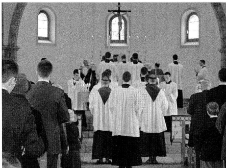
Die Weihen der Priesterbruderschaft wären nicht erlaubt gewesen.

Die Eucharistiefeier stelle der Generalobere in den Mittelpunkt des Lebens eines jeden Christen. Während des Gottesdienstes drehe der Priester dem Volk den Rücken zu, aber nicht Gott. Auf diese Weise rechtfertige sich die Praxis der Kirche, die vor dem Zweiten Vatikanischen Konzil Gültigkeit hatte. Gott