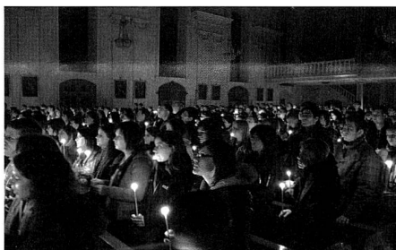
Eine Kirche voller Jugendlicher

Zwischen den Liedern geben die Jungen Zeugnis von ihrem Glaubensleben.