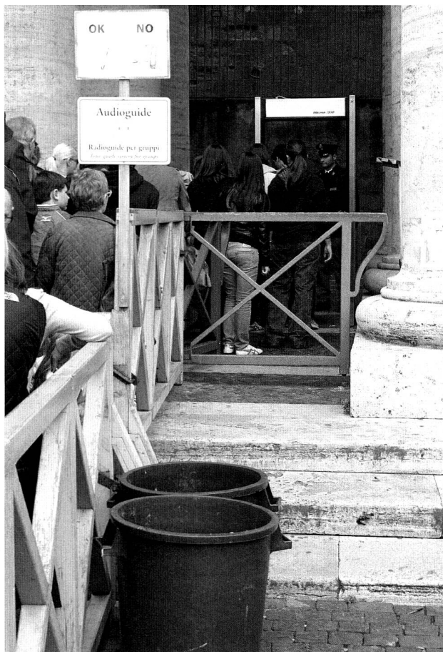
Sicherheitsmassnahmen auf dem Petersplatz.

Ist die erste Hürde genommen, weiss sich der Besucher auf Schritt und Tritt begleitet von den Blicken des zahlreich präsenten Sicherheitspersonals. Vatikanische Gendarmerie, Schweizergarde, Überwacher in Zivil: Sie alle sorgen für Sicherheit vor Ort, führen die Schlangen von Besuchern, versorgen Pilger mit Informationen und sichern die Ruhe bei