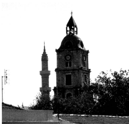
Minarett und Kirchturm, eine jahrhundertelange gemeinsame Geschichte

Deshalb, so der ägyptische Politologe Hamed Abdel-Samed, sei bis heute die Auffassung unter Muslimen weit verbreitet, die hochentwickelte Kultur der westlichen Staaten sei überhaupt nur durch den Islam denkbar. Aus seiner Sicht ein gefährlicher Selbstbetrug, der die Stagnation in der islamischen Welt