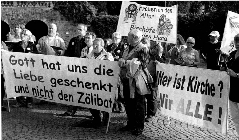
Christen treten vor dem Dom in Fulda (D) für ein Umdenken in der Kirche ein.