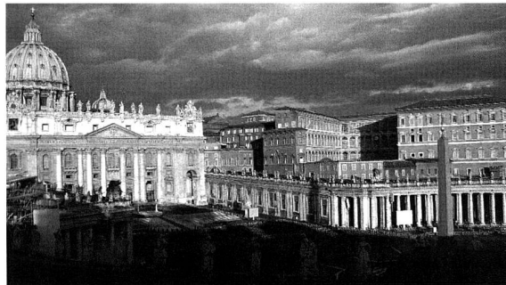
Vatileaks-Affäre: Wolken über dem Vatikan