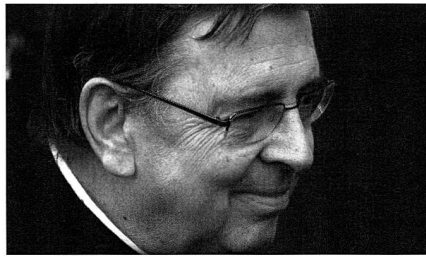
Kardinal Kurt Koch, Präsident des päpstlichen Einheitsrates

Man müsse sich auch bewusst sein, dass Europa nicht mehr der Mittelpunkt