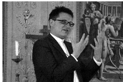
Bischof Felix Gmür, 2012

Die Pfarrei-Initiative Schweiz ist von rund 160 Seelsorgenden aus dem Bistum Basel unterzeichnet worden. Sie wurde im September 2012 lanciert. Sie benennt einiges als "selbstverständliche Praxis" in vielen Pfarrei-