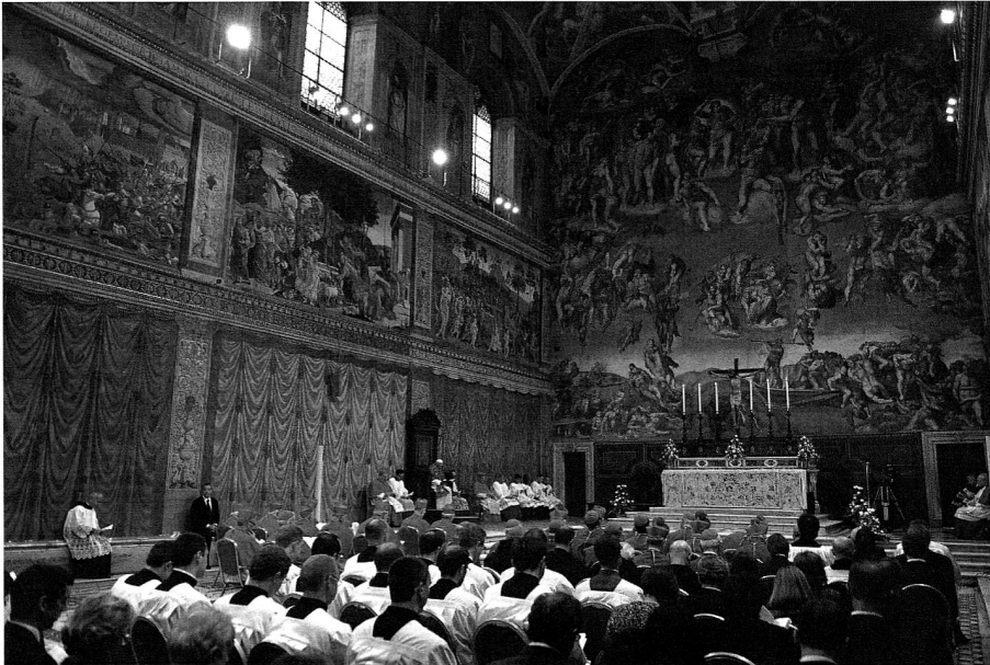
Ort des Konklave: Die Sixtinische Kapelle. Hier eine Feier mit dem emeritierten Papst Benedikt XVI. anlässlich ihres 500-jährigen Jubiläums am 31. Oktober 2012.