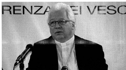
Bischof Markus Büchel

Büchel äusserte durchaus Verständnis gegenüber den Unterzeichnern der Initiative. Sie hätten eine "gemeinsame Sorge" ausdrücken wollen. Büchel: "Die Seelsorgenden, die wirklich an der Front stehen, geraten in grosse Spannungsfelder zwischen dem, was die Menschen heute von der Kirche erwarten, und den lehramtlichen Vorgaben der Kirche." Es brauche Gespräche, um diese Spannungsfelder auszuhalten. Auch müssten die Bischöfe schauen, wie sie die "echten Anliegen", die hinter der Initiative stünden, auch "gut annehmen" könn-