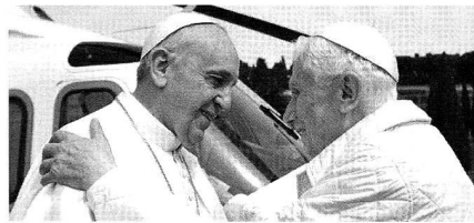
Herzliche Begrüssung in Castelgandolfo

Ob sie die Lage der Kirche oder die Situation der Kurie erörterten; ob sie über die künftige Situation und Rolle des "Papa emeritus" sprachen, der demnächst das Mater-Ecclesiae-Kloster in den Vatikanischen Gärten beziehen will;