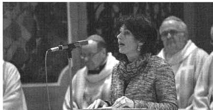
Bundesrätin Doris Leuthard

Auch für die Bischöfe stünden immer mehr Fragen an, die sie nur gemeinsam lösen könnten. Kollegialität und Einheit