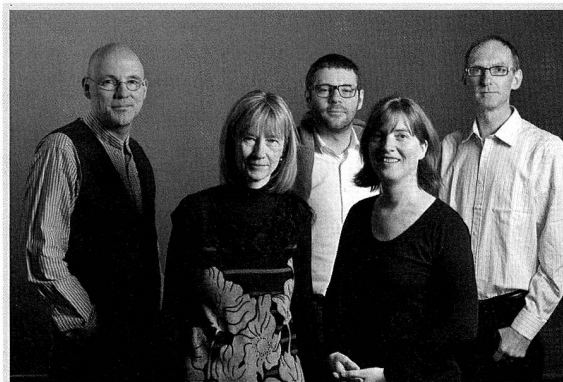
Team des Liturgischen Instituts 2013