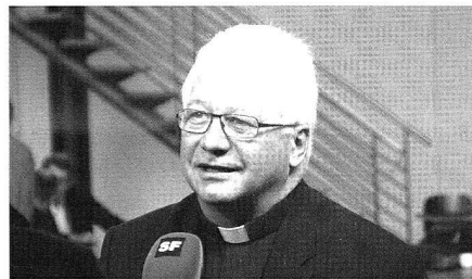
Bischof Markus Büchel an einer Pressekonferenz 2012 in Bern

Nach der Annahme der Gesetzesänderung äusserten sich auch die Initianten des Referendums. Die Organisationen