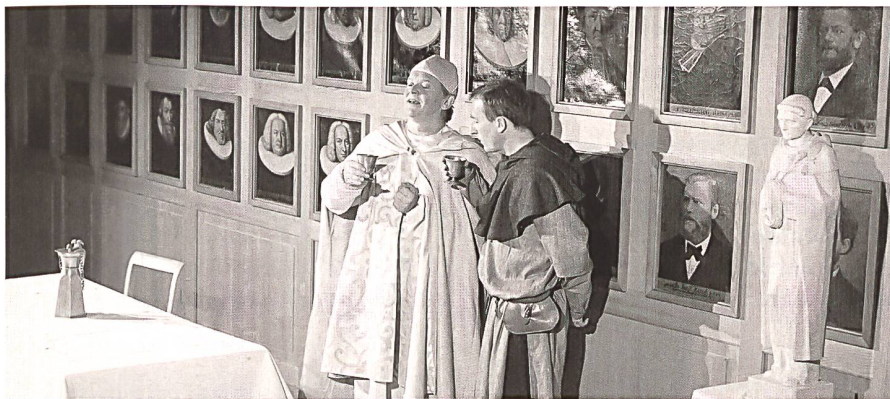
Theaterszene mit Ordensgründer Dominikus von Caleruega (rechts).