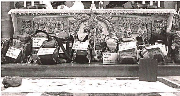
Pilgerrucksäcke, die Box mit dem Brief an den Papst und die mitgebrachten Fürbitten vor dem Cathedra-Altar im Petersdom.

Ich habe mich entschieden, mit den Frauen auf den Weg zu gehen. Es ist ein Pilgerzug nach