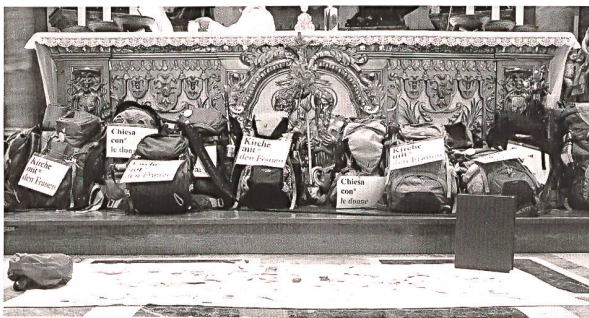
Pilgerrucksäcke, die Box mit dem Brief an den Papst und die mitgebrachten Fürbitten vor dem Cathedra-Altar im Petersdom.

Ich habe mich entschieden, mit den Frauen auf den Weg zu gehen. Es ist ein Pilgerzug nach