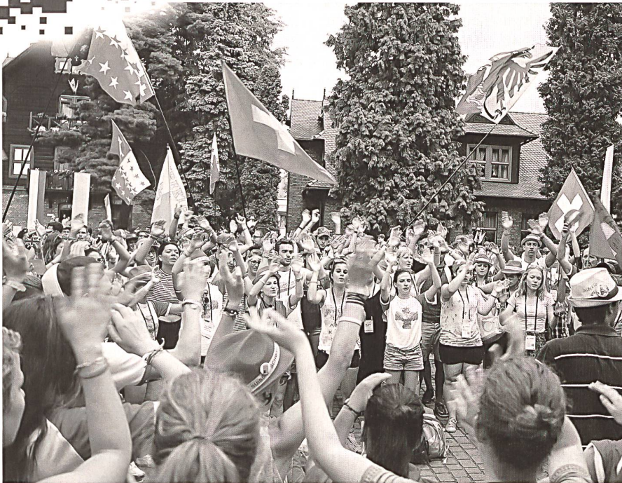
Schweizer Teilnehmerinnen und Teilnehmer am Weltjugendtag.