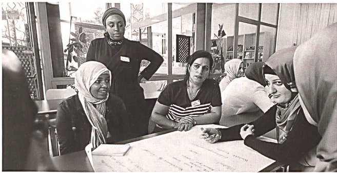
Interreligiöses Frauenparlament Bern