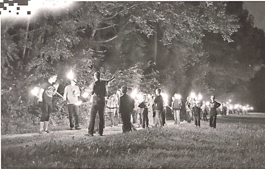
Fackelzug bei Jungwacht Blauring Schweiz