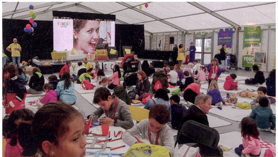
Weltfamiliientreffen 2018: «Fest der Familien» in Dublin

Dass ein Verein ein neues Angebot in der kirchlichen Ehe- und Familienarbeit schafft, wird nicht überall gleich aufgenommen. Die