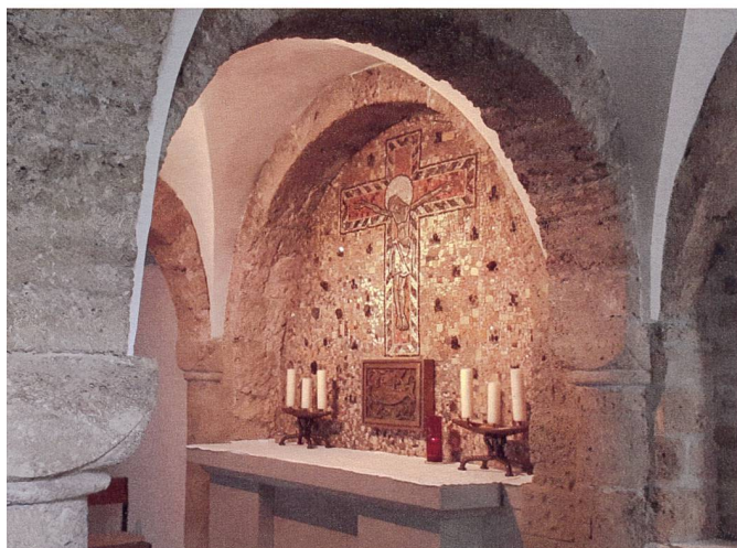
Die Hallenkrypta der St.-Luzi-Kirche mit ihrem wieder freigelegten Altarosaik.

Menschen haben ganz unterschiedliche Orte, an denen sie Kraft schöpfen. Manche Orte sind eine Entdeckung, manche haben eine lange Geschichte.