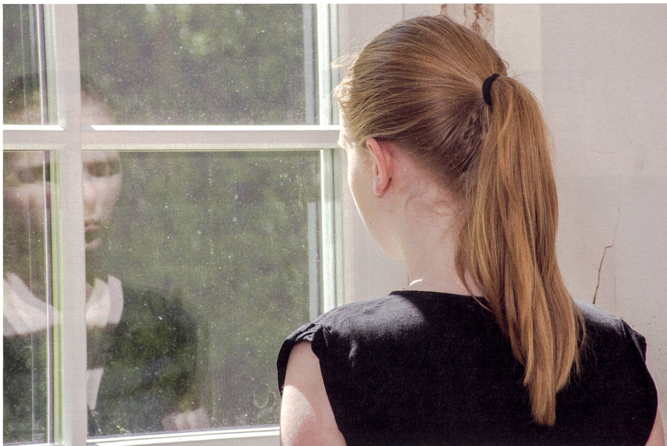
Auf der Suche nach der eigenen (christlichen) Identität.