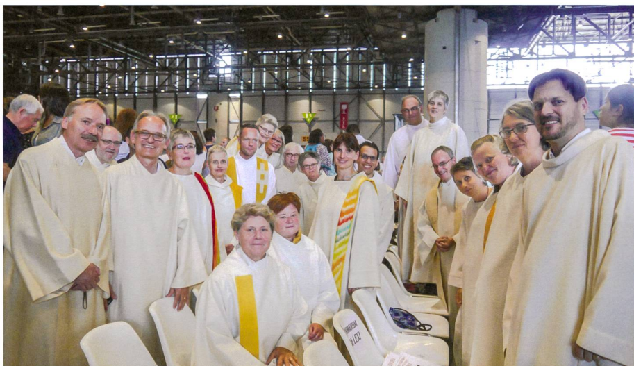
Nichtordinierte Theologinnen und Theologen sowie Priester an Papstmesse 2018 in Genf.