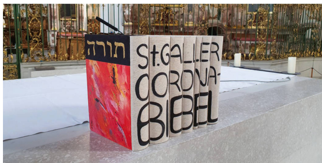
Die St. Galler Coronabibel auf dem Altar in der Kathedrale St. Gallen.

Bischof Markus Büchel (Jg. 1949) empfing am 3. April 1976 die Priesterweihe in Rüthi. Nach zwei Vikarstellen in der Stadt St. Gallen übernahm er 1988 das Amt des Pfarrers in Flawil. 1995 wurde er in St. Gallen zum Bischofsvikar und Kanonikus ernannt, wo er unter anderem ab 1999 als Domdekan (Vorsteher des Domkapitels) wirkte. Am 4. Juli 2006 wurde er zum Bischof von St. Gallen gewählt und ist zudem Apostolischer Administrator der beiden Appenzell.