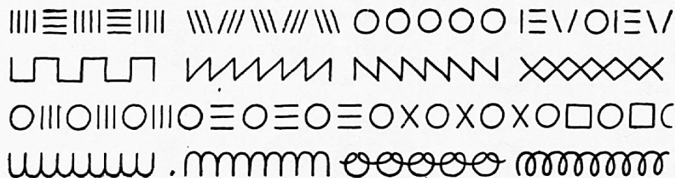
Fig. 36. Übungen für den ersten Schreibunterricht in den Primarschulen. Rhythmisches Ordnen der Buchstabelemente wecken das Gefühl für Schriftrhythmus.

Nach jeder Formgruppe sind aus ihren Buchstaben gebildete Worte zu schreiben. Im weiteren Verlauf des Schreibunterrichtes sind die Buchstabenformen der Steinschrift zu einem in aneinanderkettender Bewegung flüssig gewordenen Buchstabenbilde umzuformen, Fig. 37. Die Umformung der Buchstaben