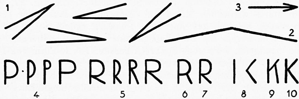
Fig. 27. Richtige (leserliche) und falsche Formung der Buchstaben R und K.

Der Buchstabe L besteht in seinen Linien aus einer Senkrecht- und einer Wagrechtgeraden. Das dem L verwandteste Buchstabenbild T weist genau die gleichen Grundlinien auf, aber in einer Zusammenfügung, die den grösstmöglichen Gegensatz bedeutet. Die Wagrechte könnte unten nach links oder in der Mitte an die Senkrechte angefügt werden und würde auch so einen Gegensatz zu L ergeben. Das genügt aber dem Schriftbildner nicht, er wählt vielmehr die dem untern Ende der Senkrechten diametral entgegengesetzte Stelle und fügt dort eine Wagrechte an, die zudem noch nach der andern Seite hin verlängert wird und damit den grössten Gegensatz zu L darstellt. Die Buchstaben H U M und N sind in der Hauptsache Liniengebilde, bei denen die Senkrechte dominiert und die beiden Senkrechten miteinander verbunden sind; beim H liegt die Verbindungsstelle in der Mitte, beim U unten, beim M oben und beim N sind die beiden Senkrechten von oben nach unten verbunden. Beim H ist die Verbindungslinie eine Wagrechtgerade, beim U eine gebogene, beim M je eine Links- und Rechts-schräge, beim N eine die ganze Buchstabenhöhe einnehmende Schräge. Nicht nur die Stelle, an welcher verbunden ist, wechselt ab, sondern auch die Form der Verbindung. N und Z sind Liniengebilde von zwei parallellaufenden Geraden