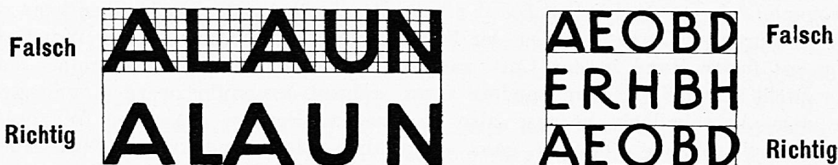
Fig. 28. Richtiges und falsches Abwägen der Zwischenflächen. Richtige und falsche Gestaltung der seitlichen Schriftfeldbegrenzung. Richtige und falsche Höhe der oben und unten rund abschliessenden Buchstaben O C G S Q.

Schon zu Anfang des Unterrichtes in ornamentaler Schrift ist zu erläutern, wie die Buchstaben aufeinander folgen sollen und wie die Schriftfelder und Zeilen seitlich oben und unten abzugrenzen sind. Zu einer derartigen Erläuterung des Zwischenflächenverteilens oder der Beziehung der Buchstaben zueinander ist eine Zeichnung Fig. 28 an der Wandtafel unerlässlich. Die Buchstabenaufeinanderfolge ist in dem Worte ALAUN mit kariertem Hintergrunde (Fig. 28) nach Abständen von Buchstabenende zu Buchstabenende geformt, und zwar in einer Weise, die nicht statthaben soll; es entstehen nämlich zwischen den einzelnen Buchstaben folgende Flächenwerte: A—L 15, L—A 30, A—U 16