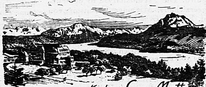
Kurhaus Sonn-Matt Luzern. 60019=M