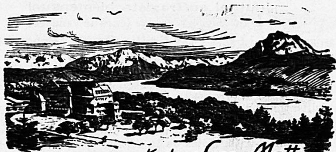
Kurhaus Sonn-Matt Luzern. 600 M. M.

Winter- und Sommeraufenthalt. Pension Leonardo da Vinci. Ruhig und sonnig. Aussicht auf das Meer. Komfortabel eingerichtet. Bescheidene Preise. Nähere Auskunft erteilt Pension Vinci, Bordighera. 716