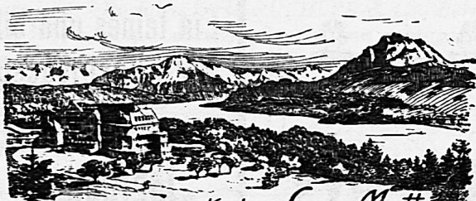
Kuchhaus Sonn-Matt Luzern. 600 M. M.