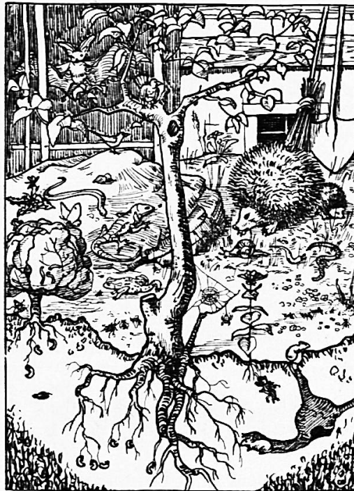
Nr. 562 Tiere im Garten, Format A 5, 8 Rp.

Nr. 563 handelt von den SBB, Format A 4, 15 Rp.