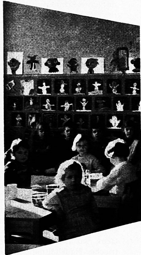
Mobiliar für Kindergärten

mit der 10-Jahres-Garantie für dauerhaften Schreibbelag und den Vorteilen: Angenehmes, weiches, blendungsfreies Schreiben und Zeichnen auf graugrün und schattenschwarzen, magnethaftenden und kratzfesten Flächen, die leicht zu reinigen sind.