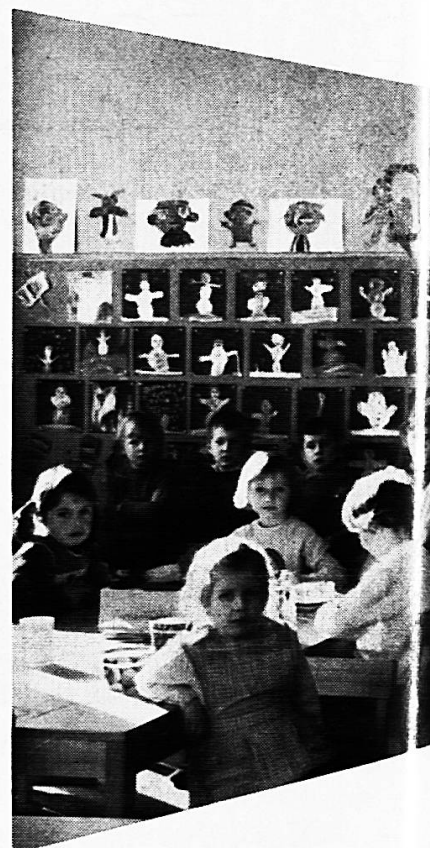
Mobiliar für Kindergärten

mit der 10-Jahres-Garantie für dauerhaften Schreibbelag und den Vorteilen: Angenehmes, weiches, blendungsfreies Schreiben und Zeichnen auf graugrün und schattenschwarzen, magnethaftenden und kratzfesten Flächen, die leicht zu reinigen sind.